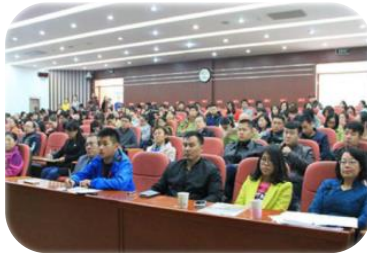
第二届内蒙古营养与食品安全学术年会 主会场