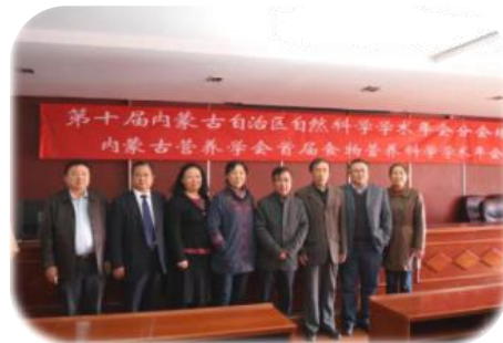
第一届内蒙古营养与食品安全学术年会 与会嘉宾与我学会理事会部分成员合影