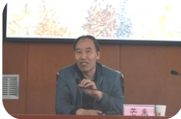
内蒙古农业大学 芒来 副校长 在“全民营养周 2017”内蒙古启动仪式