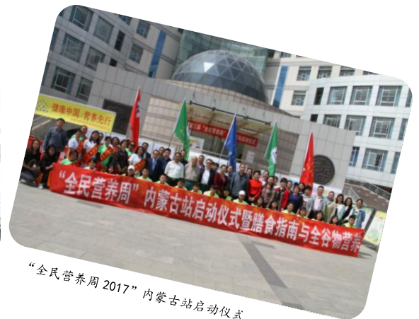
“全民营养周 2017”内蒙古站启动仪式