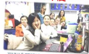
2016年11月 编辑内蒙古第二届营养与食品安全学术年会论文集之际